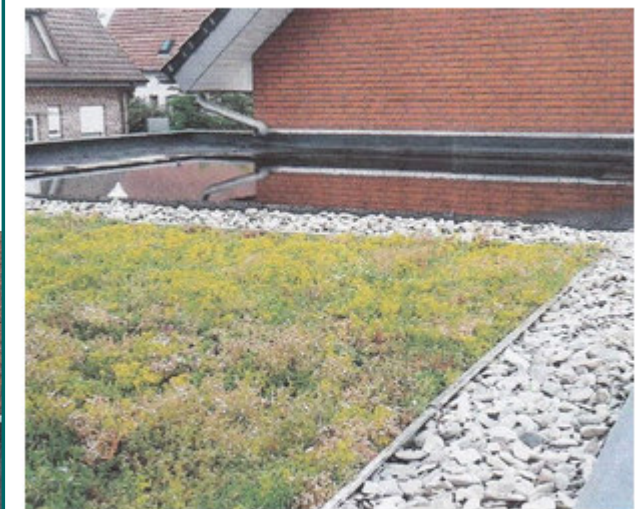
Eine Garage ergrünt