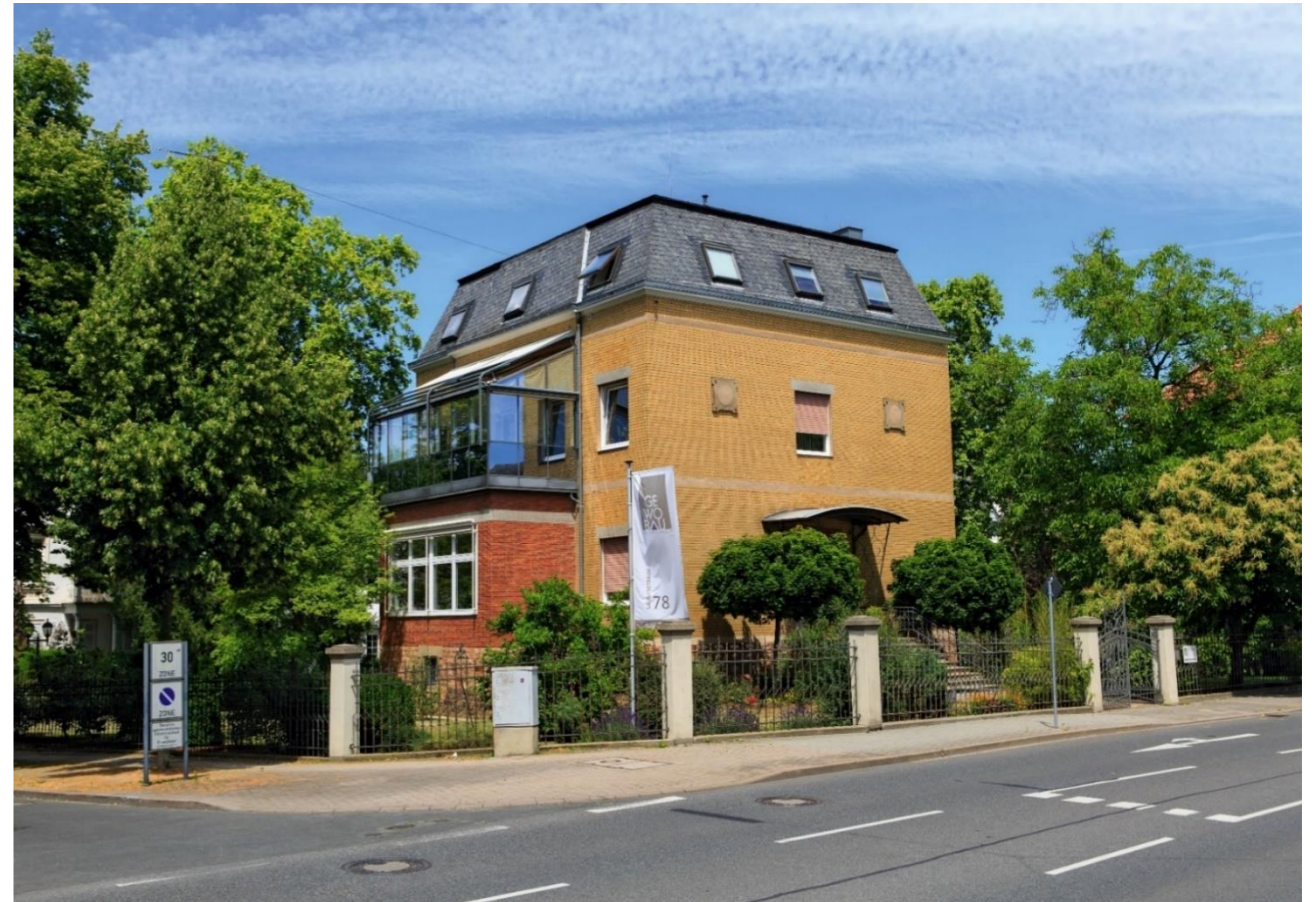
Geschäftsstelle: Salinenstraße 78, 55543 Bad Kreuznach